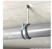
Rapido M8 - vue en situation